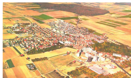
Luftbild, Gemeinde Hemmingen